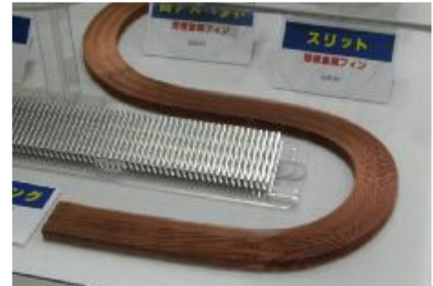
図1◎蛇腹状の放熱フィン。Cuの薄板を山-谷-山-谷...と連続的にプレスして加工した。 [クリックすると拡大した画像が開きます]

大きさや形が定まった汎用の放熱フィンを使用する場合に対し、ウェーブフィンを使えばムダのない放熱フィン設計ができる。従って、軽量化に寄与する他、材料費を1/3にできる可能性があるという。加えて、蛇腹状であることから、製品本体にも組み付けやすくなる。